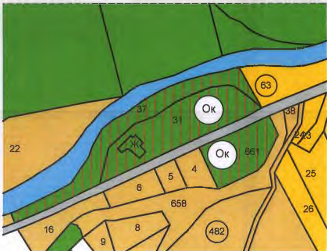
Предложение за изменение на ОУПО Севлиево за ПИ 69417.63.37 и ПИ 69417.482.661 по КККР на с. Стоките .м. Азмакът .Общ. Севлиево М 1:2000