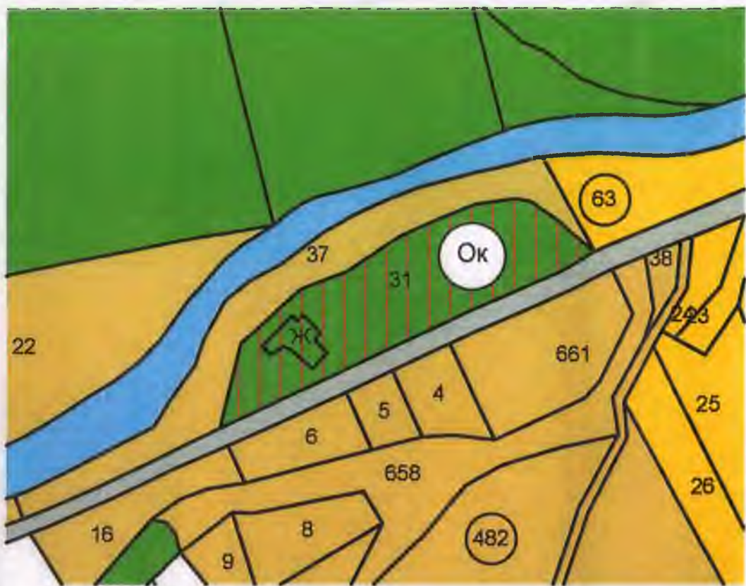
Извадка от действащия ОУПО Севлиево за ПИ 69417.63.37 и ПИ 69417.482.661 по КККР на с. Стоките .м. Азмакът .Общ. Севлиево М 1:2000