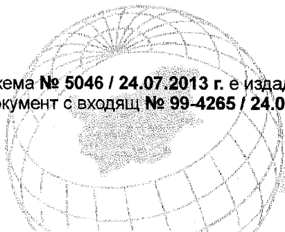
Схема № 5046 / 24.07.2013 г. е издадена въз основа на документ с входящ № 99-4265 / 24.07.2013 г.